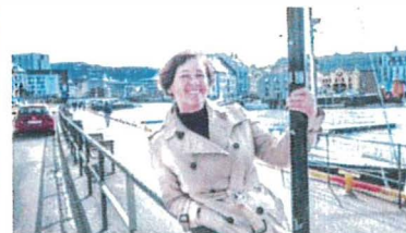
Styrer Ålesund ut av ROBEK 26/02/2019