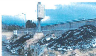
Særlig på vinteren havner gummikulene