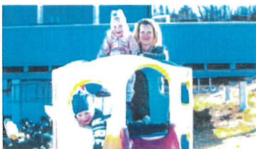
64 Seier til tvillingmamma