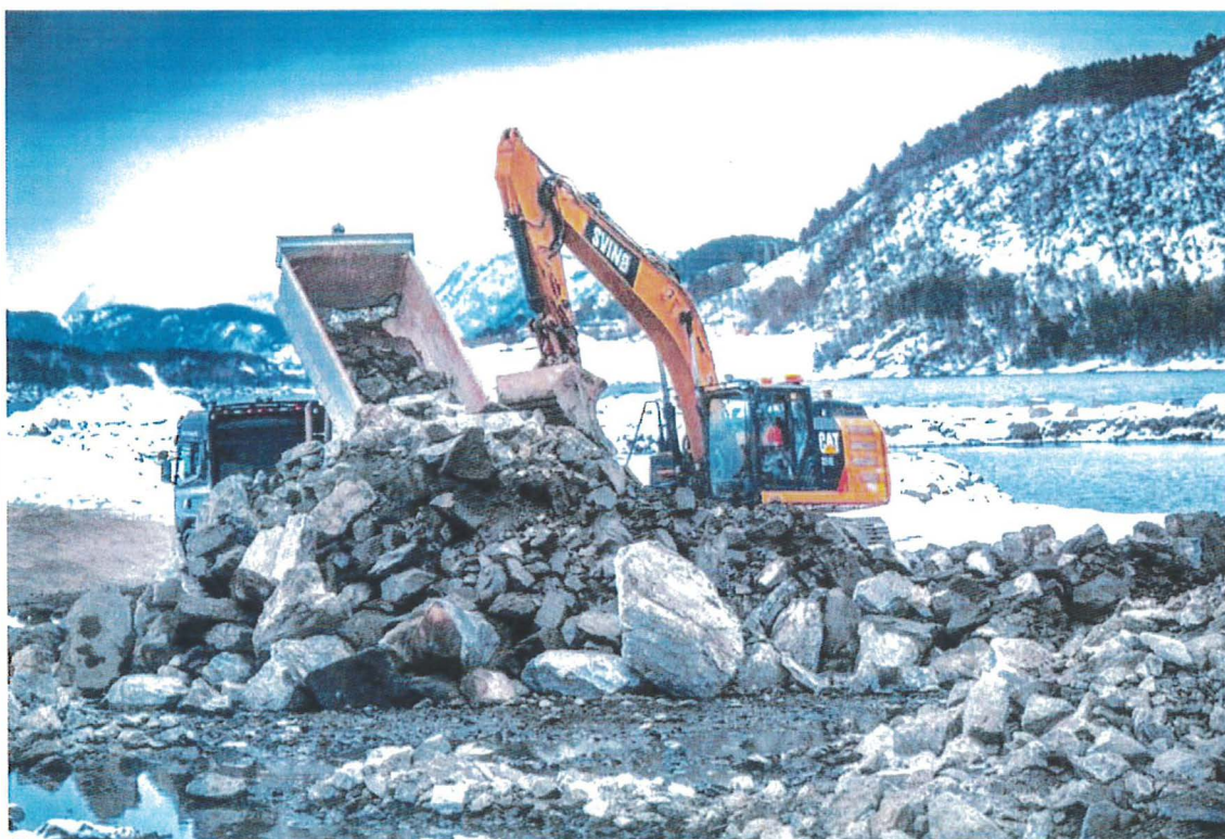
Svinø Entreprenør AS på Flatholmen.

– Det stemmer at arbeidet er i gang igjen. Fremdriften har høy prioritet nå, så jeg er glad for at vi fikk en ny løsning raskt på plass. Utførende entreprenør er Svinø, i tråd med kommunens avtaler, sier havnefogd Ole Christian Fiskaa.